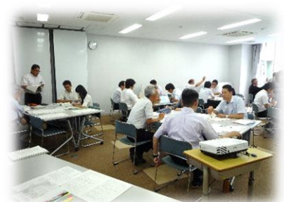
小中合同授業分析会