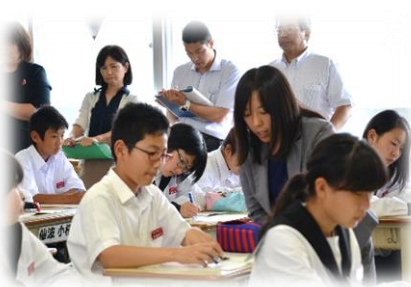
小中合同授業研究会