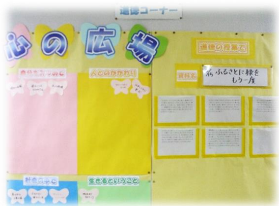
毎授業の感想やそれに関連した掲示物を学年ごと掲示し、多様な考え方に触れる。