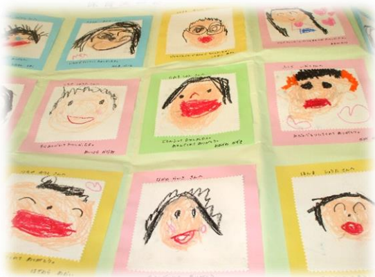
保育実習訪問先の園から届いた似顔絵 「お兄さんお姉さんありがとう」 ～思いやり・感謝～